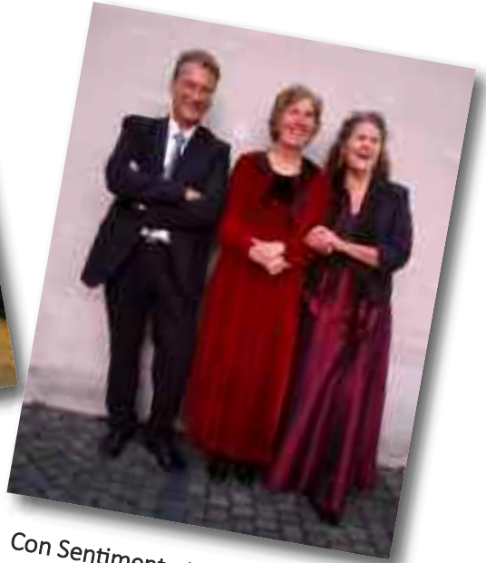
Con Sentimento in der Kirche in Lünern