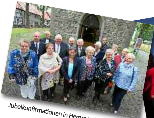
Jubelkonfirmationen in Hemmerde und Lünern