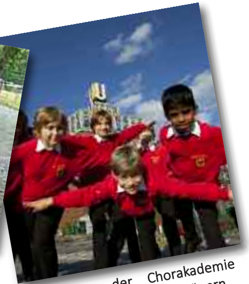
Knabenchor der Chorakademie Dortmund in der Kirche in Lünern