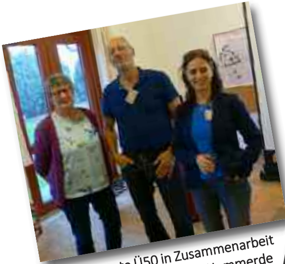
Lebenskonzepte Ü50 in Zusammenarbeit mit der VHS Unna-Kamen in Hemmerde